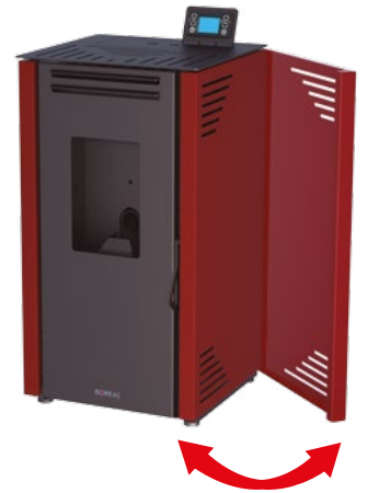
Las cámaras laterales permiten un rápido acceso a los componentes de la estufa, facilitando las labores de mantenimiento.