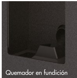
Quemador en fundición