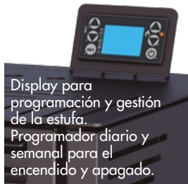
Display para programación y gestión de la estufa. Programador diario y semanal para el encendido y apagado.