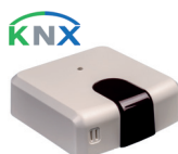
IS-IR-KNX-1i (CL 99 096)